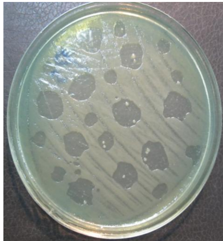
شکل شماره ۱ ب. ایجاد پلاک های با اندازه متفاوت توسط فازهای اختصاصی سودوموناس آئروجینوزا در سویه استاندارد سودوموناس آئروجینوزا ATCC 27853

سیستوویریده متعلق باشد و نمونه مورد مطالعه Psu2 همانند نمونه Psu1 دارای مورفولوژی شش وجهی و بدون دم می باشد و از نظر مقیاس مشاهده شده دارای ابعاد تقریبی ۳۰ نانومتر است که با مقاومت به کلرفرم به نظر می رسد به خانواده لویویریده متعلق باشد(شکل شماره ۲).