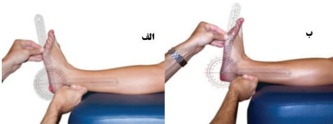
شکل شماره ۱. چگونگی اندازه گیری دامنه حرکتی دورسی فلکشن مچ پا به وسیله گونیامتر. الف) وضعیت طبیعی، ب) وضعیت انتهایی

ویژگی های فردی گروه IASTM (میانگین ± انحراف استاندارد سن ۱۹/۰۷±۱/۲۸، وزن ۷۵/۸۰±۶/۰۰ و قد ۱۷۹/۲۰±۷/۰۳) و گروه تمرینات کششی PNF (میانگین ± انحراف استاندارد سن ۱۸/۸۷±۰/۷۴، وزن ۷۲/۴۰±۵/۳۵ و قد ۱۷۶/۰۷±۵/۱۲) در جدول شماره ۱ ارائه شده است. نتایج آزمون یومن ویتنی (جدول شماره ۲) نیز بیانگر آن بود که علی رغم این که در پیش آزمون دامنه حرکتی دورسی فلکشن گروه ها تفاوت معناداری با هم