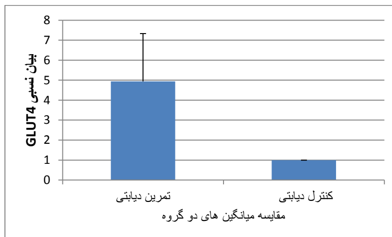
نمودار شماره ۲. بیان ژن نسبی GLUT4 بافت عضله دوقلو در دو گروه کنترل دیابتی و تمرین دیابتی

هم چنین نتایج به دست آمده در ارتباط با مقایسه بیان نسبی ژن GLUT4 در گروه کنترل دیابتی با گروه تمرین دیابتی نشان دهنده افزایش