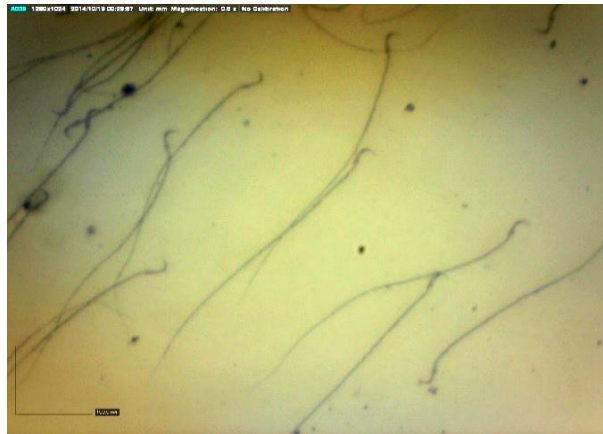
شکل شماره ۱. اسپرم طبیعی رت (درشت نمایی ۱۰×۱۰)