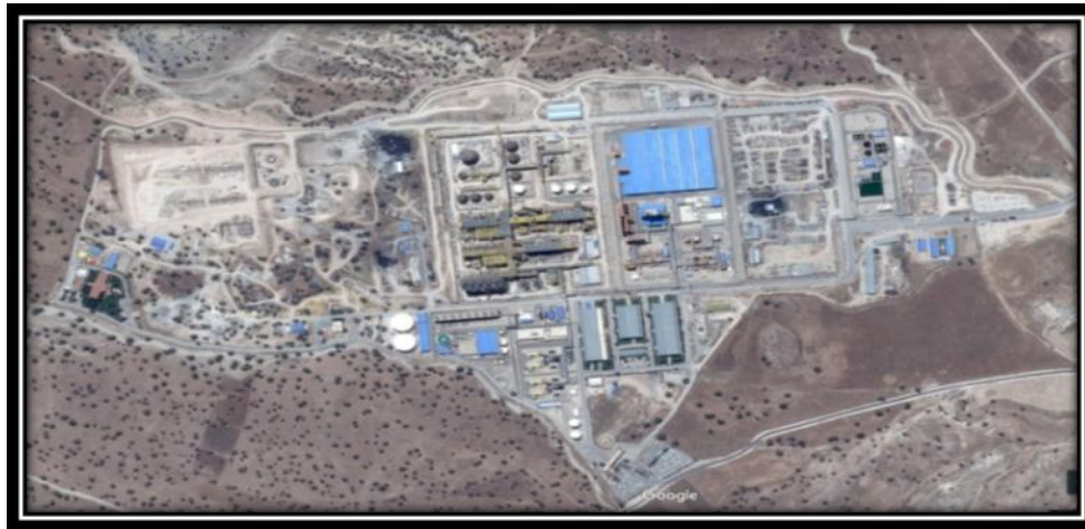
شکل شماره ۱. تصویر ماهواره ای مجتمع پتروشیمی ایلام

پتروشیمی ایلام شامل یک واحد الیفین با تولید اتیلن، پروپیلن، بنزینیپروپیلن، برش های چهار کربنه و سوخت مایع به ترتب با ظرفیت ۴۵۰، ۱۲۰، ۱۴۰، ۸۵ و ۹/۵ هزار تن در سال می باشد. کل محصول اتیلن تولید شده مجتمع به عنوان خوراک واحد پلی اتیلن جهت تولید پلی اتیلن سنگین به مصرف می رسد(شکل شماره ۱).