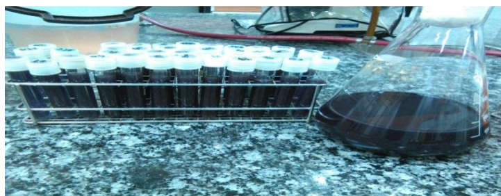
شکل شماره ۱. تلقیح باکتری ها در محیط کشت نوترینت براث حاوی رنگ روبین دیپرسی

استفاده از این روش کار، مبتنی بر روش کار و نتایج مثبت کسب شده در پژوهش های انجام شده توسط نوحی و همکاران در سال ۱۳۸۷ که ۱۰۰ درصد رنگ زدایی توسط سویه های جداسازی شده بومی مشاهده شد، بود (شکل شماره ۱).