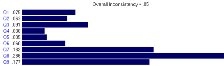
شکل شماره ۱. رابطه بین بخش و مولفه های مورد مطالعه

ارتقای شغلی بیشتر رابطه را داشت و تاثیر نوع بخش بر این سه عامل در رضایت کارکنان مورد مطالعه بیشترین تاثیر را داشت.