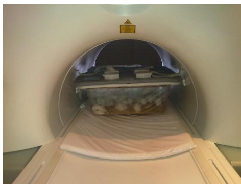
شکل شماره ۱. نحوه قرارگیری محفظه پلاستیکی حاوی موش ها جهت تابش امواج دستگاه MRI ۱/۵ تسلا