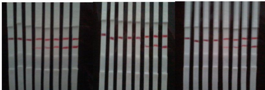
شکل شماره ۳. نتیجه حاصل از اعمال محلول مورفین سولفات به کیت های با OD=1 و BSA-مورفین با غلظت های الف) ۱ (ب) 0.5 و ج) 1/5 \text{ mg/ml} (الف) (ب) (ج)