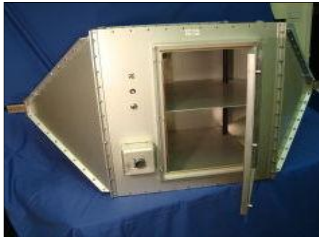
شکل شماره ۱. نمایی از یک اتاقک الکترومغناطیس عرضی

سیستم های پرتودهی تمام بدن اتاقک های الکترومغناطیس عرضی (TEM cell): اتاقک الکترومغناطیس عرضی رایج ترین سیستم مورد استفاده از گذشته تاکنون است. به دلیل کوچکی به آسانی در محفظه