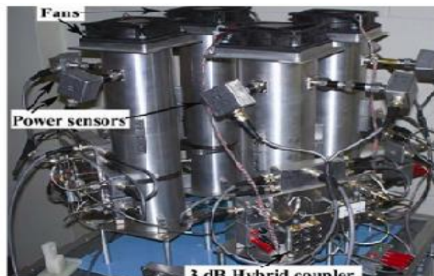
شکل شماره ۳. نمایی از موج بر شعاعی

موج بر شعاعی: موج برهای شعاعی برای پرتوهای تمام بدن انواع مختلفی از حیوانات طراحی شده اند. در این موج برها می توان حداکثر ۱۲۰ حیوان را هم زمان پرتوهای کرد (شکل شماره ۳). حیوانات در یک حجم کوچک حرکت آزادانه دارند و در نگهدارنده های مخصوص قرار نگرفتند (۳).