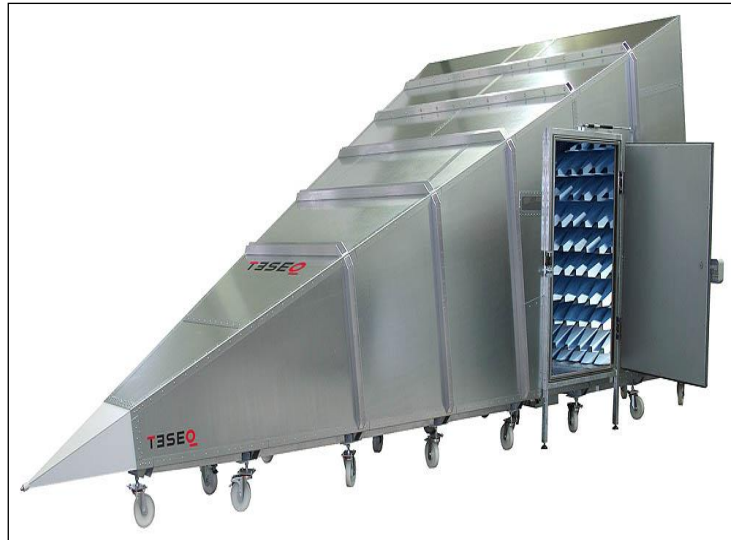
شکل شماره ۲. نمایی از اتاقک GTEM cell

در این جا چند مورد از مطالعات صورت گرفته با استفاده از اتاقک GTEM آورده شده است. نمونه ای از تحقیقات اولیه که با GTEM cell انجام شد مطالعه ای بود که توسط دکتر لو و همکاران در زمینه اثرات تابش امواج الکترومغناطیس بر فشارخون موش صورت گرفت. این آزمایش با پرتوهای شش دقیقه ای امواج رادیوفرکانسی UWB از نوع پالسی با آهنگ جذب ویژه تمام بدن 0.07 \text{ W/kg} انجام شد و مشخص گردید که فشارخون انقباضی و انبساطی پس از ۴۵ دقیقه تا چهار هفته بعد از پرتوهای به طور چشمگیری کاهش یافت (۳). مطالعه ای دیگر با استفاده از GTEM cell با پرتوهای امواج رادیوفرکانسی از نوع ماکروویو برای بررسی آسیب DNA در سلول های کلیه، کبد و مغز صورت گرفت. در این تحقیق موش های آزمایشگاهی در مدت دو هفته، هر روز یک ساعت در معرض میدان