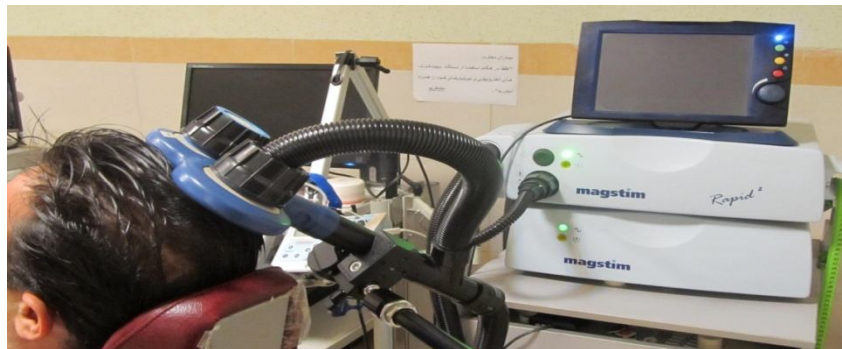
تصویر شماره ۱. محل قرار گرفتن کویل دستگاه

گروه شاهد (۲ بیمار حاد و ۴ بیمار مزمن)، توانبخشی مرسوم اندام فوقانی مربوط به بیماران همی پلژی را دریافت کردند به این صورت تمرینات مشخص و ثابتی در قالب حرکات فانکشنال به مدت ۶۰ دقیقه توسط این بیماران انجام شد. در تمرین درمانی از الگوهای عملکردی ترکیبی اندام فوقانی، تحرک مفاصل ساعد، مچ دست و انگشتان، کشش عضلات هایپرتون به صورت آرام و تقویت عضلات ضعیف اندام فوقانی در الگوهای تحمل یا غیر تحمل وزن