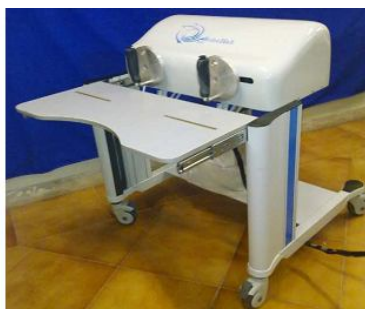
تصویر شماره ۲. ربات در حالت ارزیابی سوپینیشن-پرونیشن

ساخته شده و پس از انجام آزمون های فنی و بالینی به منظور کمک در بازتوانی و ارزیابی دامنه حرکتی و سفتی مفاصل اندام فوقانی در برابر حرکت با سرعت ثابت بیماران با مشکلات نورولوژیکی و ارتوپدی استفاده می گردد. این دستگاه پس از طراحی و ساخت مورد ارزیابی بر روی بیماران همی پلژی قرار گرفته و اعتبار و تکرارپذیری دستگاه در طی انجام تحقیقات در دانشگاه صنعتی شریف ثابت شده بود، (۲۰، ۱۹، ۱۸). این دستگاه قابلیت انجام و سنجش حرکات فلکسیون-اکستنسیون مچ دست و سوپیناسیون-پروناسیون ساعد را در موده های اکتیو، پسیو و ثبت نمودار گشتاور- زاویه مفاصل در برابر سرعت ثابت را دارا بوده و نمرات کمی و ابجکتیو از وضعیت بیماران ارائه می دهد، (۱۹). در روش های سنتی سنجش اسپاستی سیتی عضلات از تست ابجکتیو اشوردس استفاده می گردد. به دلیل دخالت ارزیاب، امکان خطا در ارزیابی و وجود تفاوت نمره در ارزیابی توسط دو آزمونگر وجود دارد. هم چنین بهبودی بسیار جزئی ممکن است برای ارزیاب و بیمار نمایش داده نشود که در بهبود روحیه بیمار و تصمیم گیری برای ادامه روند درمان اثر گذار است.